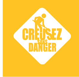
Surimpression sur la couleur du fond